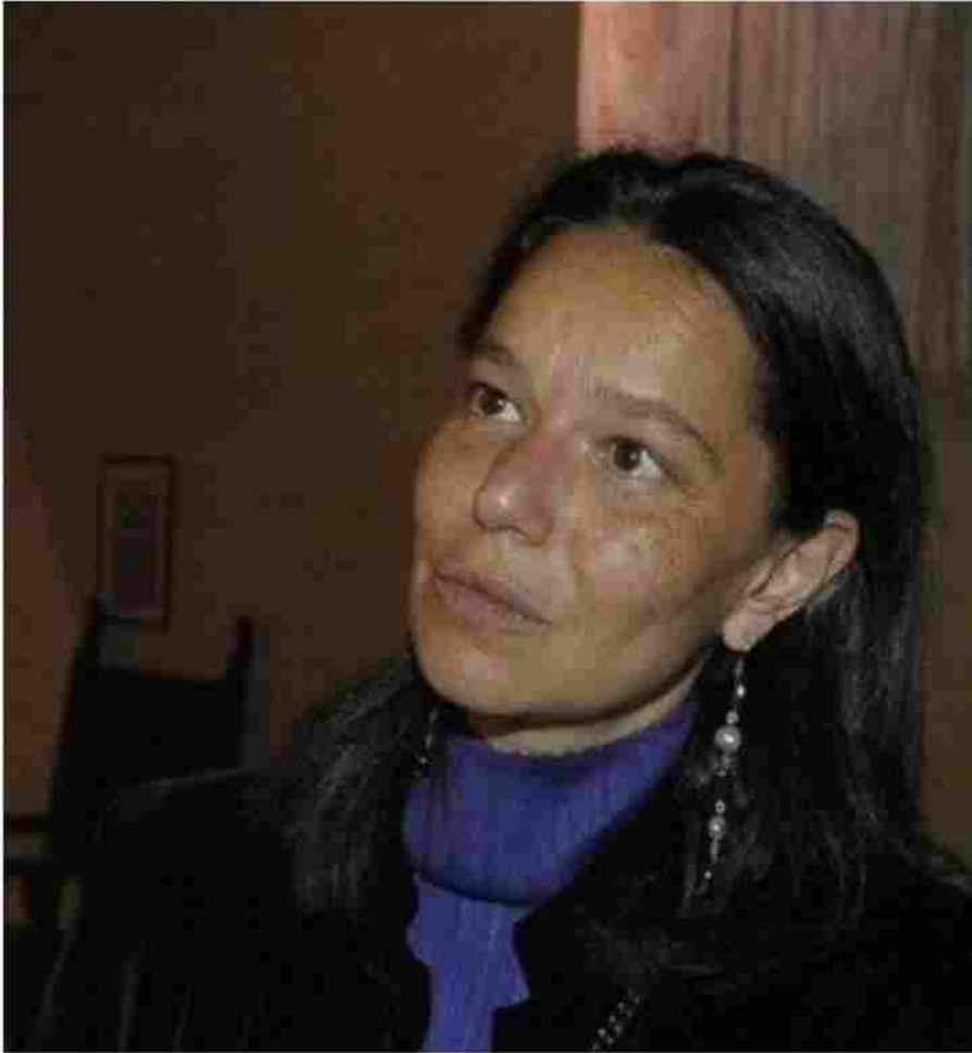
(Presidente del Consiglio del Conciliatore Bancario Finanziario)

Tratto da “ Lessico Finanziario “ di Beppe Ghisolfi – ARAGNO Editore