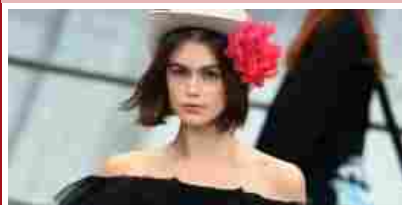
Kaia Gerber sexy in passerella come mamma Cindy Crawford