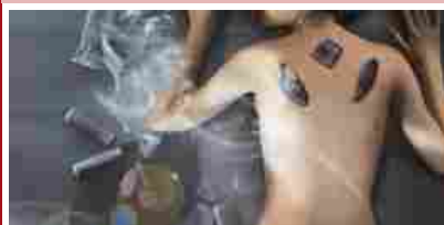
Cristalloterapia, quando le pietre rigenerano corpo e mente