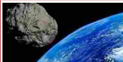
Asteroide più grande di un grattacielo si dirige verso la Terra