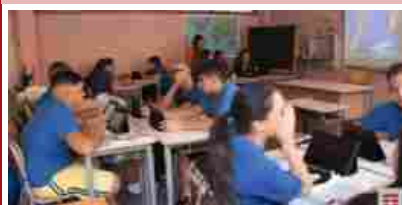
La Tim porta la scuola a casa degli studenti