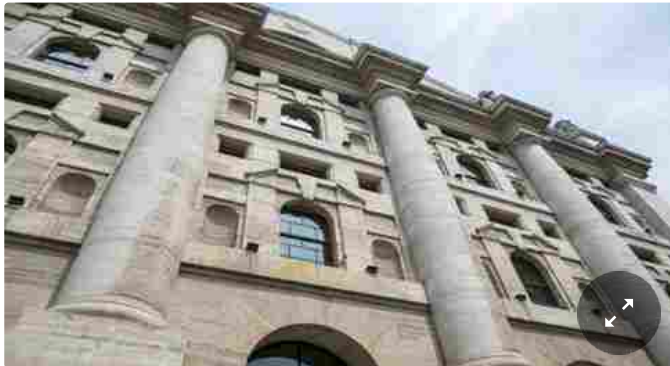
2 Minuti di Lettura