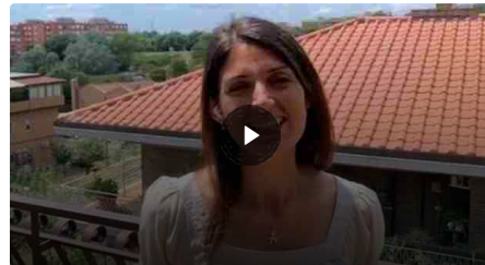
Virginia Raggi: «Grazie per gli auguri di compleanno»